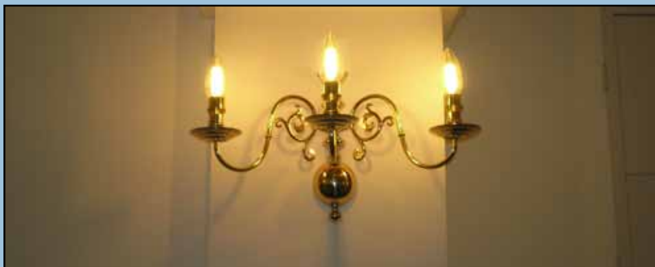
Lampetterne fra 1940

Mere om istandsættelsen af Vejgaard Kirke side 8 - 9