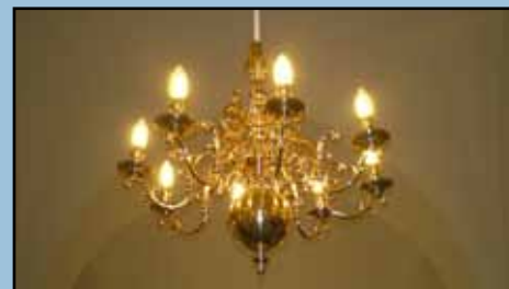
Lysekronerne fra 1940

Det var ikke kun selve kirkeskibet, der blev ændret. Kirkens kor mod øst fik også sin part af restaureringen. Gulvet i koret blev hævet med et helt trins højde i forhold til tidligere og belagt med lyse sten.