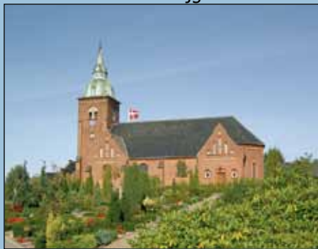
Vejgaard Kirke Vejgaard Kirkevej 11 vejgaard@vejgaardsogn.dk