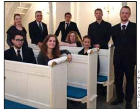
Vejgaard Kirkes Koncertkor

Søndag 10. april kl. 19:30 (Mariæ Bebudelsesdag) i Vejgaard Kirke Uddrag af Bachs Magnificat (Marias lovsang), samt korværker til påsken opføres af Vejgaard Kirkes Koncert-