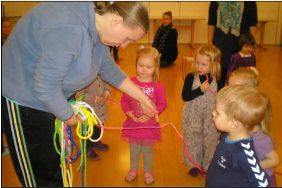
Børn på Bongo2-holdet gør klar til at gå på line