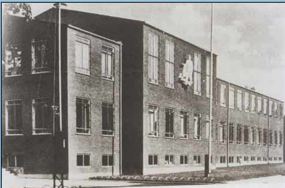
Hadsundvej 35, 1942

Vejgaard Lokalhistoriske Forening holder til i Vejgaard Bibliotek, Hadsundvej 35, 1. sal og har åben første tirsdag i måneden kl. 19 – 21 og anden og fjerde onsdag kl. 14 – 16