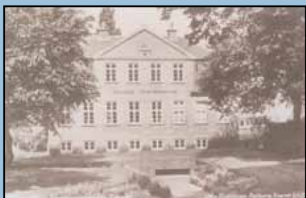
Vejgaard Folkebibliotek lå bag Hadsundvej 33, ca. 1930

Huset, der blev revet ned i 1940, var beliggende der, hvor Vejgaard Bibliotek nu er.