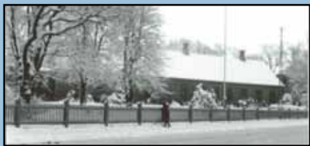
Hadsundvej 35, før 1916

I 1860'erne blev 'Fredensbo' bygget som stuehus til gården 'Vejgaard'. Fra 1917 til 1940 var huset kommunkontor for Nørre Tranders kommune.