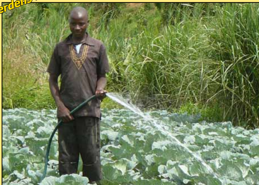
Foto: Vanding med solcellepumpe i Malawi.