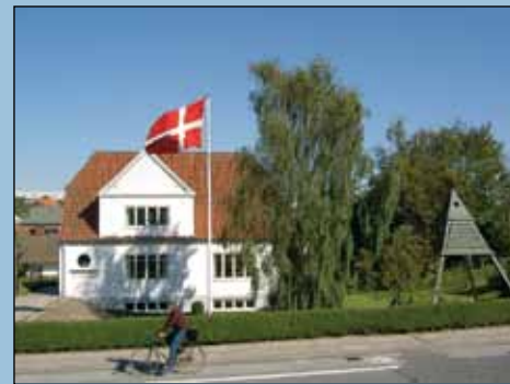
Lejbjergkirken Hadsundvej 177 lejbjerg@vejgaardsogn.dk