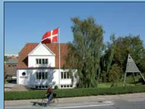
Lejbjergkirken Hadsundvej 177 lejbjerg@vejgaardsogn.dk