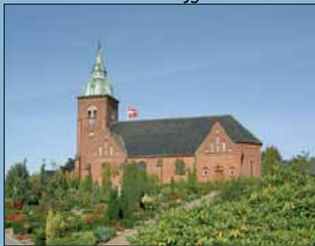
Vejgaard Kirke Vejgaard Kirkevej 11 vejgaard@vejgaardsogn.dk