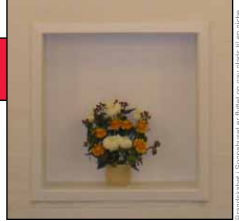
Brandskabet i Sognehuset er flyttet og gav plads til en niche

I 2012 fortsætter vi med at drøfte visioner for sognet og fortsætter den